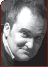
ПИШЕ: Зоран Јеремић