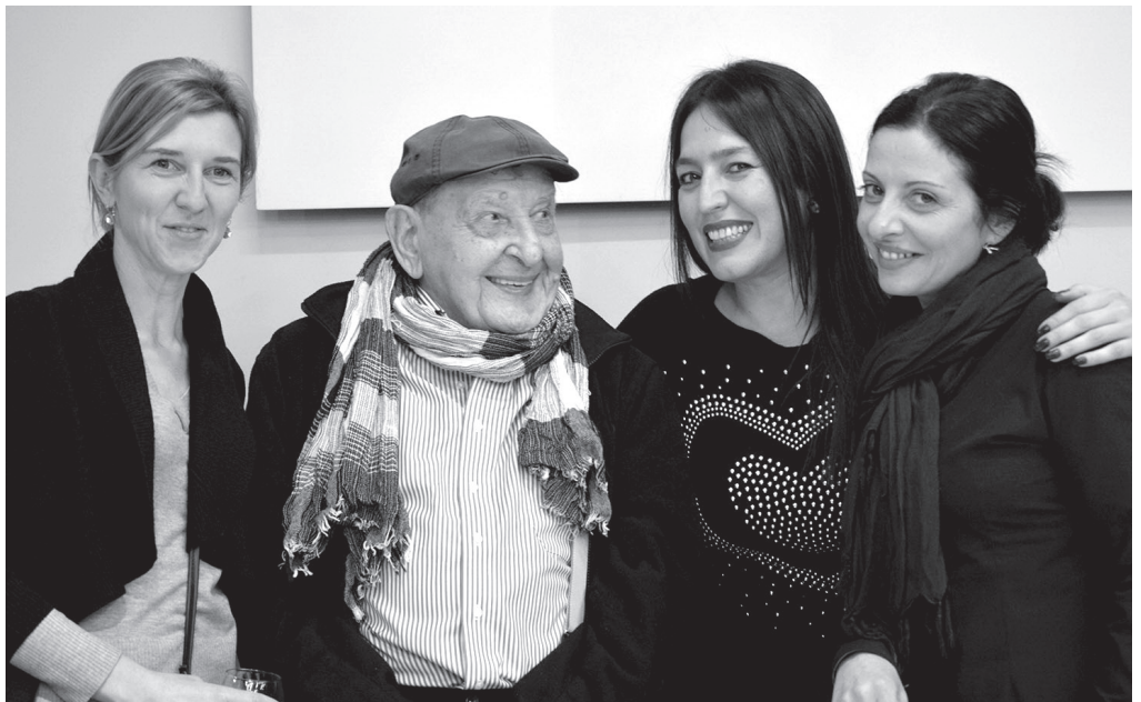
Власта са ужичким новинарками које прате ЈПФ